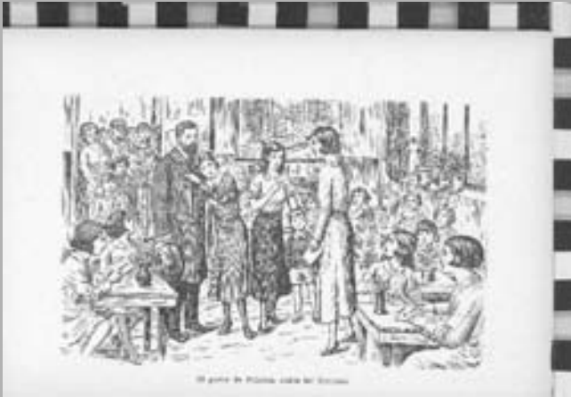
Dimensions: 14x8,8 cm Autoria: sense firma