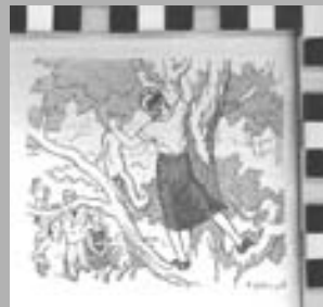
Dimensions: 9,4x8,1 cm Autoria: R. Fàbregas

Les diferents parts que componen Diana constitueixen una narrativa biogràfica. Integra en les diferent parts, el conte, el diari i, finalment, el llibre de viatges. Tres maneres de narrar que, justament, el feminisme europeu d'inicis de segle havia reclamat com a instruments per dir des de la veu femenina.