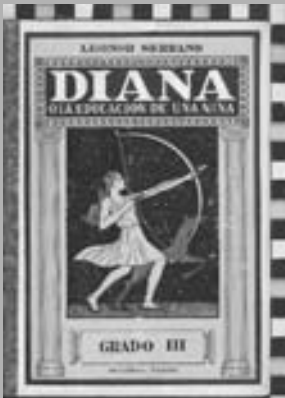
Dimensions: 7,8x9,8 cm Autoria: J. Lisboa

La imatge de la portada dels llibres de Diana –nom llatí, d'arrel indoeuropea dieu , que al·ludeix a qui té naturalesa divina– ens remet a la mitologia romana i grega en què Diana era la deessa de la caça, protectora de la natura, vinculada a la lluna. Se la caracteritza per la seva castedat, la força i gràcia atlètica, la bellesa i les grans habilitats en la caça. Alhora se la coneix com a defensora de la maternitat i de la infància. Aquestes característiques estan presents en la protagonista d'aquesta obra de Leonor Serrano, com ja gràficament s'il·lustra en la portada 23 , així com en diferents de les il·lustracions presents en el llibre, com ara la referent a la caça de l'esquirol 24 .